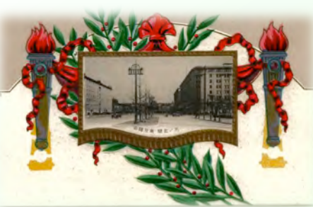
帝都復興記念はがき

「はがき」展～帝都復興記念はがきなど～/ 藩札と松坂羽書 4月1日（火）～6月29日（日）入館料（300円）のみ