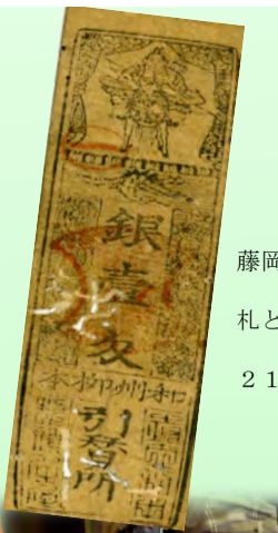
藤岡家所蔵の藩札と松坂羽書 21枚展示