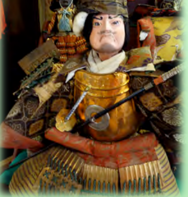
武者人形・武者のぼり