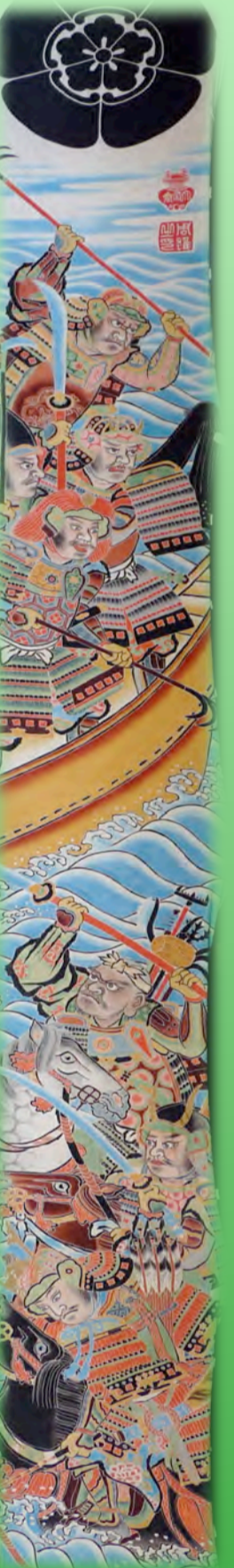
武者人形・武者のぼり（4月5日～6月5日）全館にて