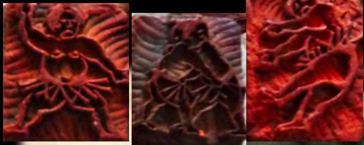
思案坊の描いた川柳画