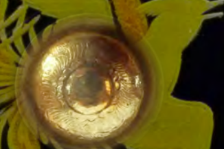
金彫鳥図盃 (江戸時代)