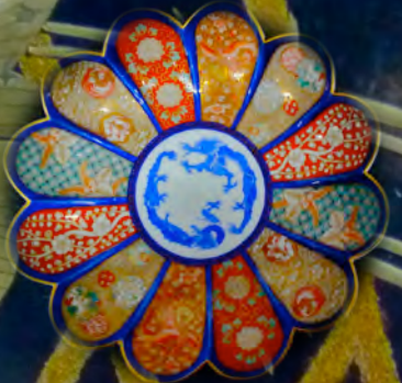
深川製染金彩鳳凰菊割親皿 (明治時代)