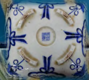
嘉慶年製青磁角作足付平鉢 (江戸時代)