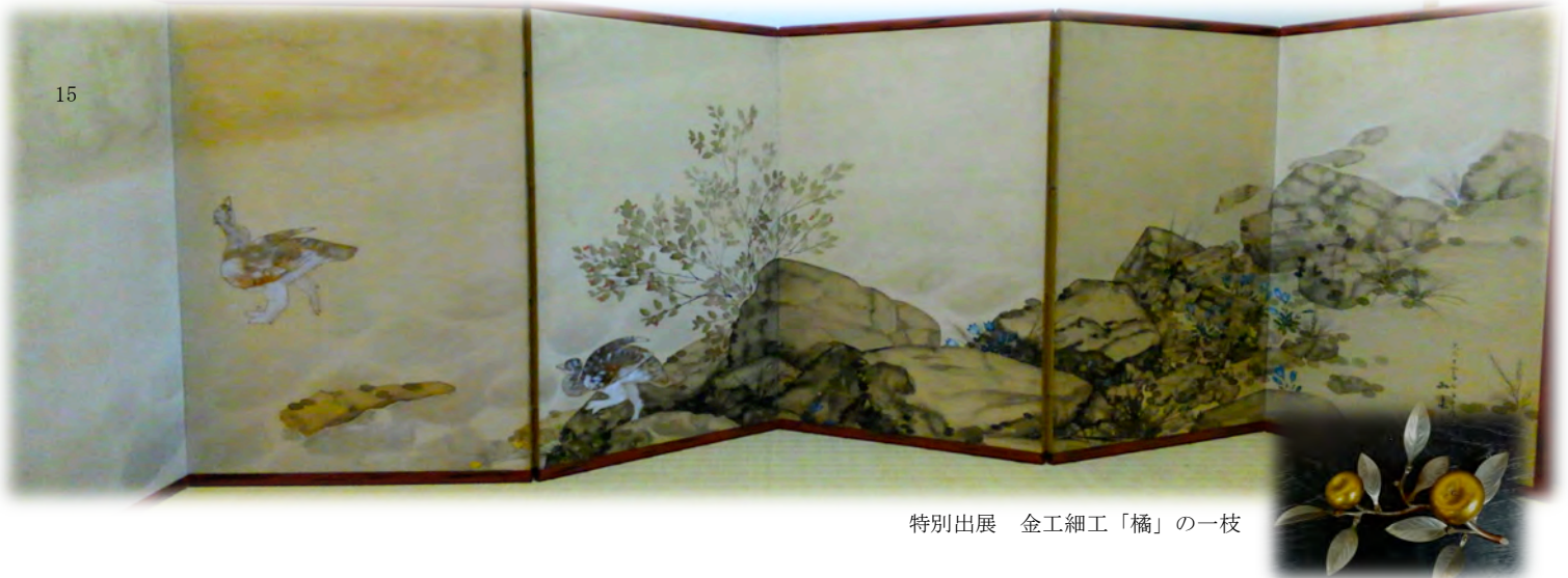
特別出展 金工細工「橘」の一枝

茶器など「鳥」の意匠の名品をおよそ 40 点展示します。（内蔵展示室 2 階と 1 階部分にて）鳥は吉祥の象徴とされているため、多くの優れた美術工芸資料のコレクションがありました。この機会に貴重な品々をご鑑賞下さい。なお 4 月 8 日から 6 月 10 日までは母屋では「武者人形・武者のぼり」を展示しています。神功皇后、武内宿禰の武者人形や義経弓流しの場を描いた幅 2 尺長さ 9 尺の武者のぼりなどを展示します。