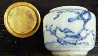
兎鳥鹿図 茶入れ (江戸時代)