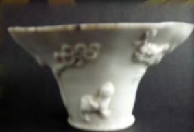
銘 兎觥(じこう) 絵高麗 旧大津 僧茶付 伝物