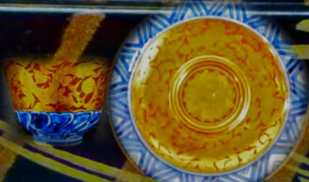
赤絵金襴手大日本永楽造 14代楽善五郎 (明治時代)