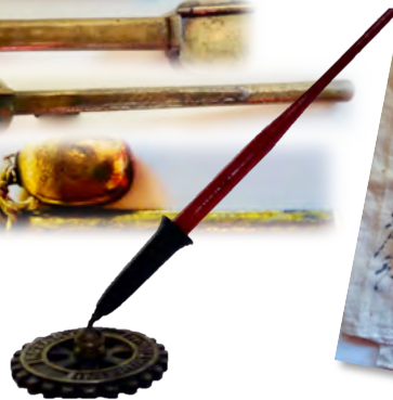
ロータリークラブ ペン立