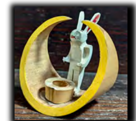
強度玩具「月うさぎ」