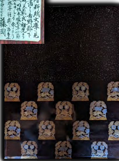
花兎蒔絵料紙文庫(江戸時代)